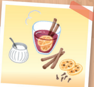
赤ワインを使って