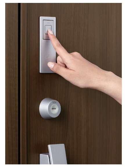
タッチキー[電池式]

キー付リモコンがあればタッチするだけで解錠。室内に入ってドアが閉まると鍵が自動で閉まります。